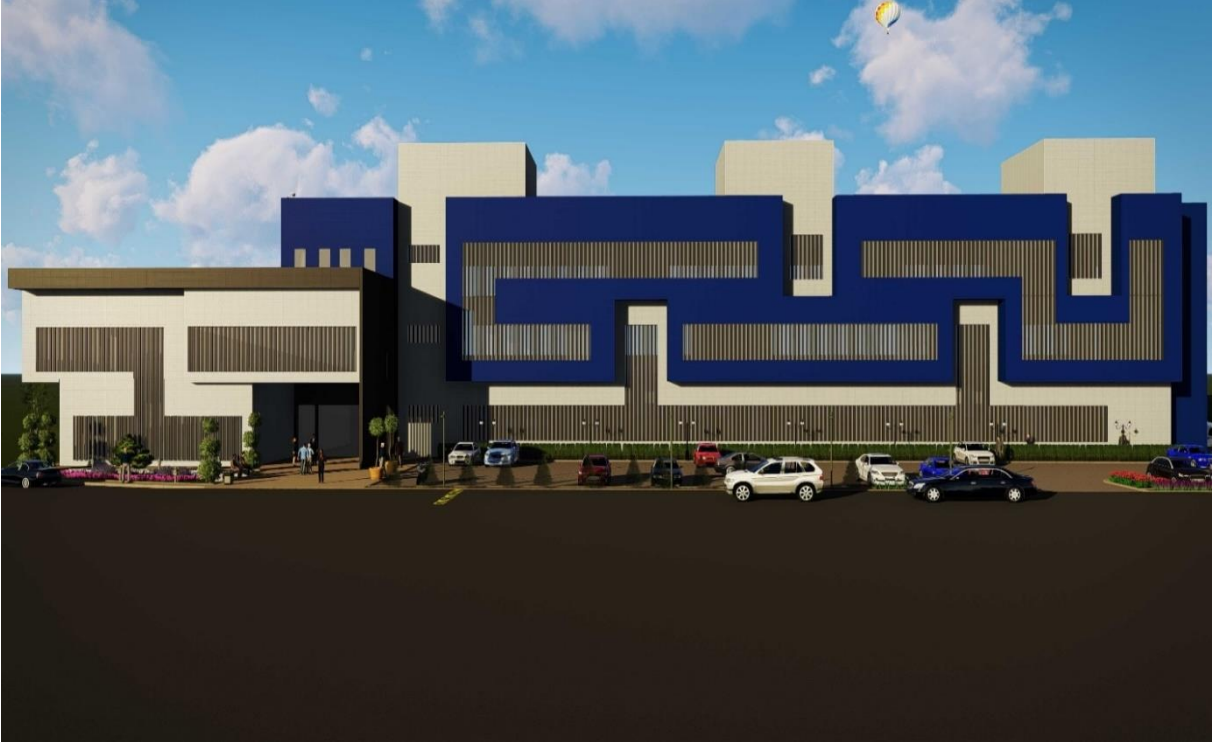
Merkezi Araştırma Laboratuvarı

Etüt ve projesi tamamlanan 4.400 m 2 kapalı alana sahip Merkezi Araştırma Laboratuvarları binası içerisinde fen ve sağlık alanında hizmet verecek 32 adet laboratuvar (+5 adet rezerv), 4 numune odası, 20 ofis, 2 lisansüstü ofis, 1 toplantı odası, 1 seminer odası ve 1 kafeterya bulunacaktır.