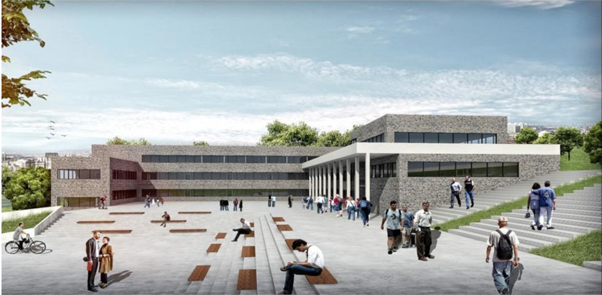
Delice Meslek Yüksekokulu İnşaatı

2019 yılı Yatırım Programı ile Delice Meslek Yüksekokulu İnşaatı alt projesine 2.800.000,00 TL başlangıç ödeneği tahsis edilmiş olup yıl içindeki revize işlemleri sonrasında 3.120.185,00 TL ödenek harcanmıştır.