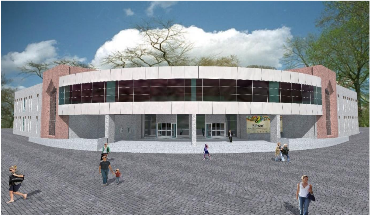
Kongre ve Kültür Merkezi

Derslikler ve Merkezi Birimler İnşaatı Projesinin alt projesi olan Kongre ve Kültür Merkezi İnşaatı Projesinin 2019 yılı başlangıç ödeneği 5.000.000,00 TL'dir. Yıl içerisinde yapılan ana projenin alt projeleri arasında ve projeler arasında (Muhtelif İşler Projesi-Eğitim Sektörü) yapılan revizyon işlemleri sonucunda toplam ödeneğin 2.031.382,00 TL'si harcanmıştır.