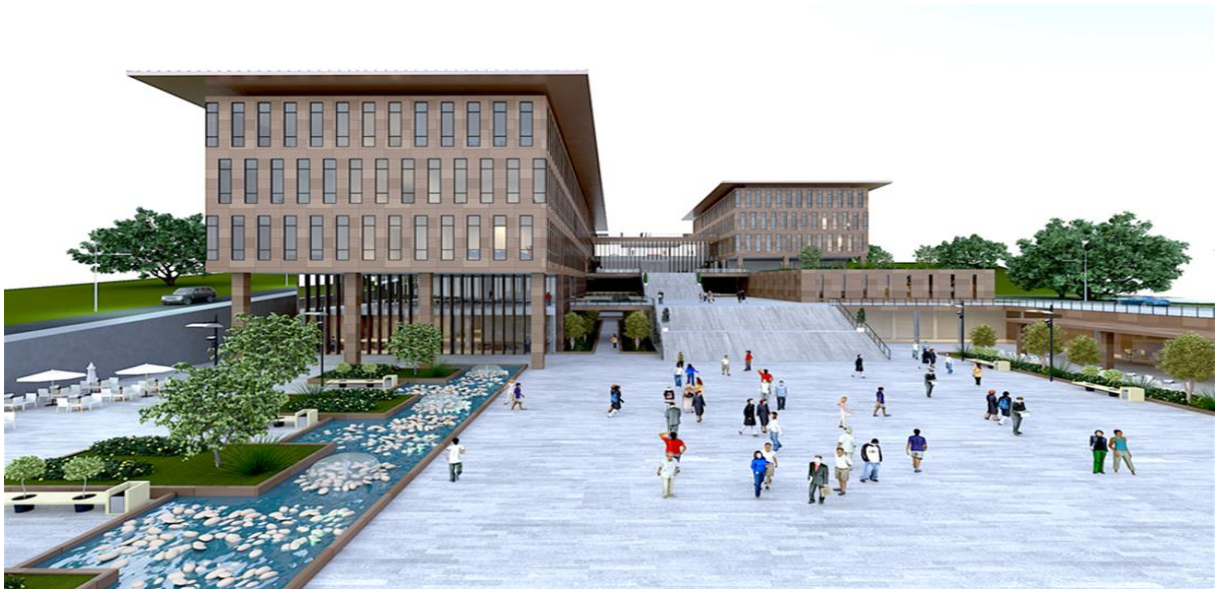
İslami İlimler Fakültesi

Spor Toto Teşkilat Başkanlığı Yönetim Kurulunun almış olduğu karar gereğince, Üniversitemize İslami İlimler Fakültesi binası yaptırılması amacıyla 33.487.500,00 TL ödenmesi uygun görülmüş ve bu durum her iki kurum tarafından bir protokol ile imza altına alınmıştır. Üniversitemizin ihtiyaçları doğrultusunda projelendirilen İslami İlimler Fakültesi inşaat ihalesi, yıllara sari olacak şekilde (2018-2020), 18.04.2018 tarihinde yapılmış ve ihalesi uhdesinde kalan firmayla, 13.06.2018 tarihinde sözleşme imzalanmış ve 22.500 m 2 inşaat imalatına başlanmıştır.